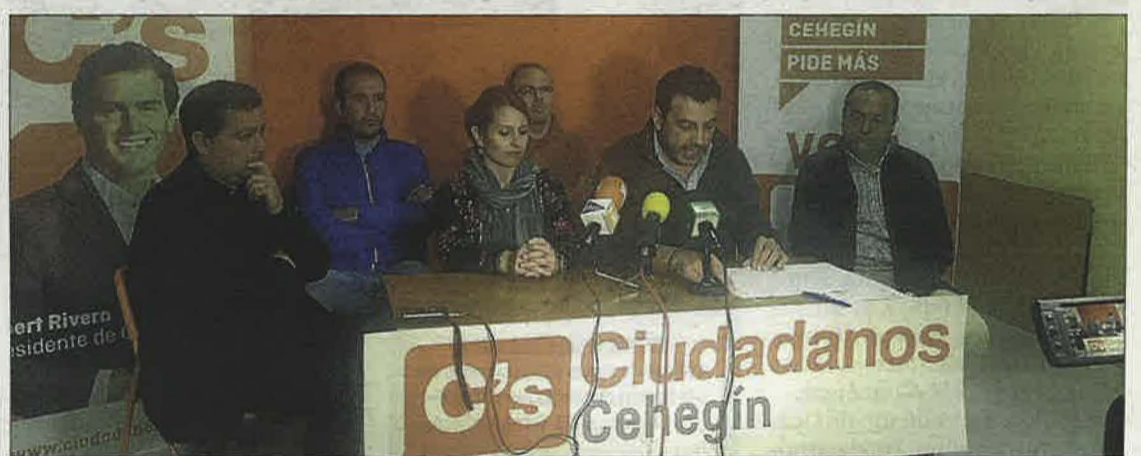
C's alega que la comisión «es un órgano ineficaz» y que «sólo ha mantenido tres reuniones». ENRIQUE SOLER