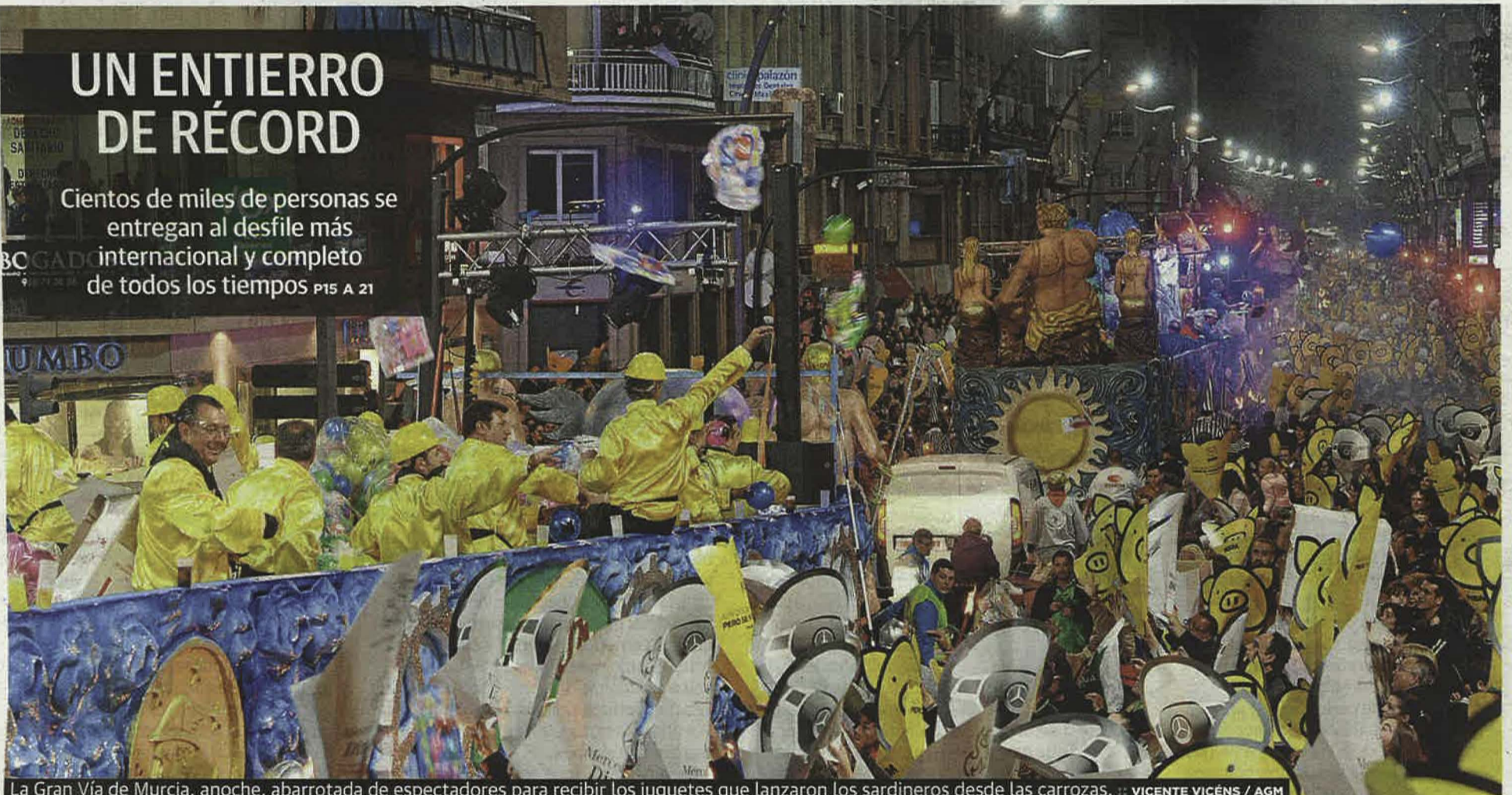
La Gran Vía de Murcia, anoche, abarrotada de espectadores para recibir los juguetes que lanzaron los sardineros desde las carrozas.

Cientos de miles de personas se entregan al desfile más internacional y completo de todos los tiempos P15 A 21